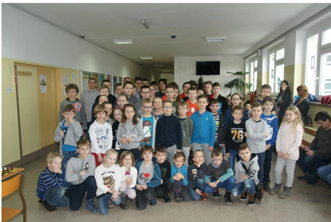
Uczestnicy jednego z turniejów pierwszej edycji ligi. Bydgoszcz 2018r.

Projekt rozwija się bardzo dynamicznie. Jego twórcy widzą głęboki sens tego co robią. Regularnie zachęceni przez rodziców do dalszej pracy, doszli do wniosku, że należy zrezygnować z ograniczeń ligi do miasta Bydgoszczy i najbliższej okolicy, otwierając się na całe województwo, a nawet - całą Polskę. Jeśli ktoś ma ochotę przyjechać z kraju, to od września będzie miał taką możliwość.